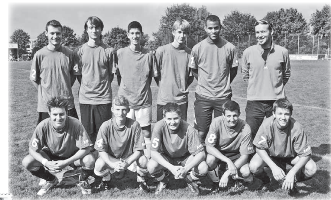
Hottinger Helden: Unsere siegreichen Fussballer am kantonalen und nationalen Mittelschulsporttag.

Nicht verpassen! Freitag, 16. Dezember: Adventskonzert in der Aula (18.30 Uhr)