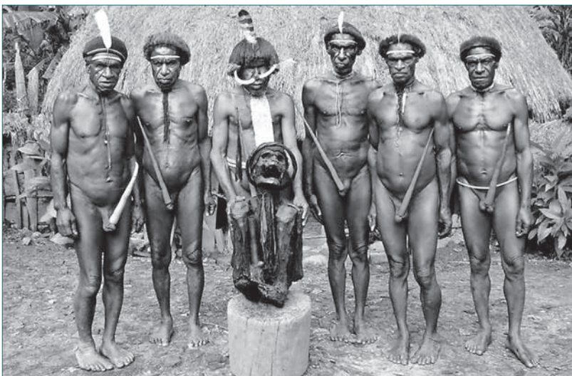
Angehörige des Papuastammes der Dani im Hochland von Westpapua

Marken – oder auf gut Neudeutsch Brands – spielen in der Überflussgesellschaft daher eine gewichtige Rolle. Konsumenten bauen schon im Kindesalter emotionale Beziehungen zu Brands auf, die sie vorgelebt bekommen. Man nennt diesen Prozess im Fachjargon trefend Markensozialisierung. Seit der Entdeckung von Kindern und Jugendlichen als Zielgruppe für Konsumgüter und Werbung Anfang der 90er-Jahre nimmt der Druck auf die junge Käuferschaft kontinuierlich zu. In wohlhabenden Ländern wie der Schweiz – und dort besonders in urbanen Gebieten – ist er am stärksten und auch im Schulalltag sichtbar. Gebrauchsartikel sind längst zu Statussymbolen mutiert, das neueste i-phone und die trendigsten Markenkleider garantieren einen Prestigezuwachs unter den Mitschülern, der über andere Kanäle (wie etwa schulische Leistung) ungleich schwerer zu erlangen ist.